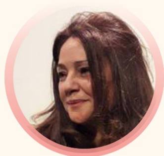
Fawzia Zouari, escritora tunecina